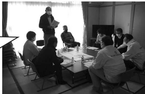
▲ 1/21 大芝地域

災害時の参集訓練をしよう! 何を持ってどう逃げるのか、自宅待機するには何を備えるのか、実際に考えてみよう。