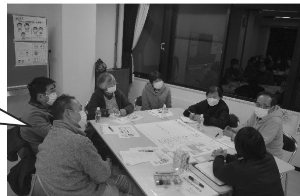
▲ 1/26 風早地域