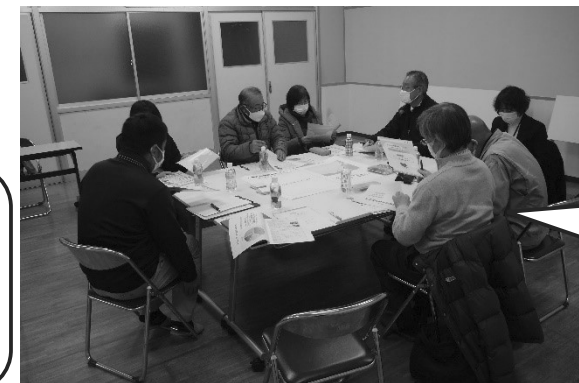
▲ 1/28 小松原地域

小学校を中心とした、子供たちが主体となれるような地域行事を。子どもを通して、関わる機会ができる!