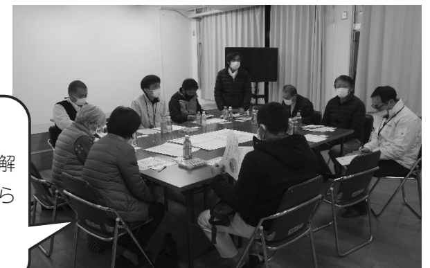
▲ 1/31 大田地域

「ちょっとした困りごと」を相談する場所や地域で解決できる仕組みがあったらいいな~