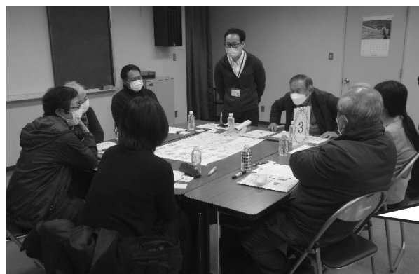
▲ 1/18 三津地域

昨年の地域懇談会では、地域の強みや地域課題、自分たちが取り組めることなど意見を出していただき、「第4次地域福祉活動計画」に反映しました。今年は、顔なじみの関係性がある身近な地域で、つながりづくりをすすめていくためになにが必要か意見交換を行い、いただいた意見をもとに、地域の皆様とともに「つながり」「気づき」「支え合う」地域づくりを目指し、具体的取り組みを進めていきます。