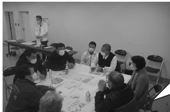
▲ 1/25 木谷地域

地域まつりやとんどは、世代間のコミュニケーションの場! コロナで中止していたけど、継続し、伝承していきたい!