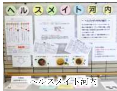
ヘルスメイト河内