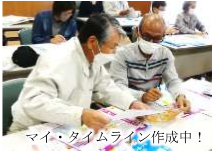
マイ・タイムライン作成中！