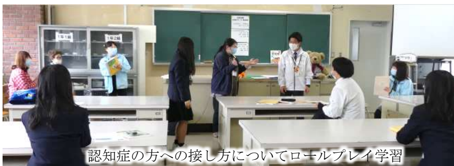
認知症の方への接し方についてロールプレイ学習