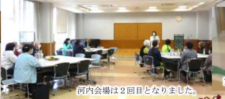
河内会場は2回目となりました。