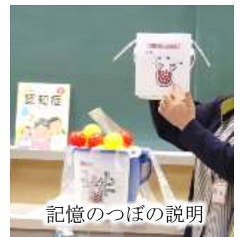
記憶のつぼの説明

これからも「認知症になっても安心して暮らせる地域づくり」を目指し、関係機関や施設、地域福祉活動者等と連携し、学校や地域等で認知症への理解を深めていただくための取り組みを推進してまいります。