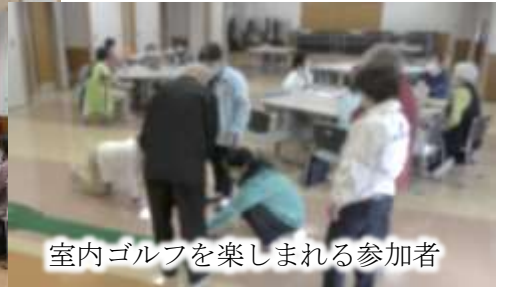
室内ゴルフを楽しまれる参加者