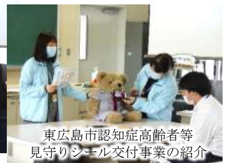
東広島市認知症高齢者等見守りシール交付事業の紹介