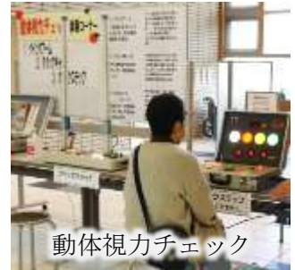
動体視力チェック