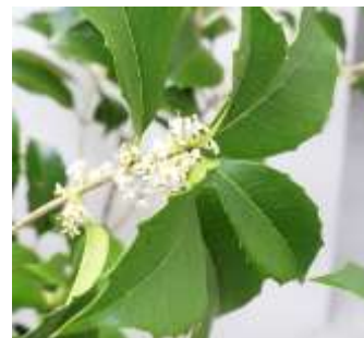
▲杉森神社のギンモクセイ