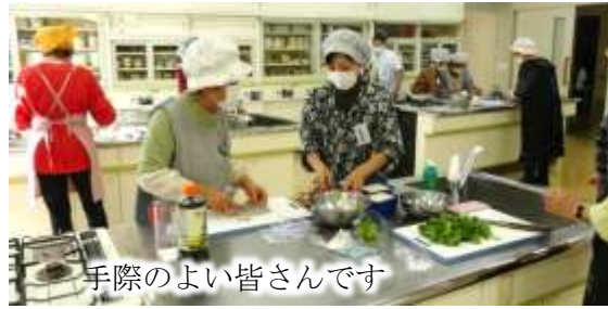
手際のよい皆さんです