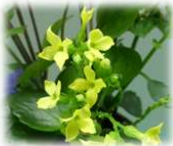
▲カランコエ 花言葉：「たくさんの小さな思い出」