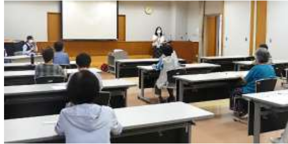
▲コロナウイルス感染対策の中での開催