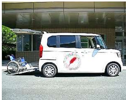
▲福祉車両等の貸出し