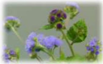
▲アゲラタム 花言葉：「信頼」