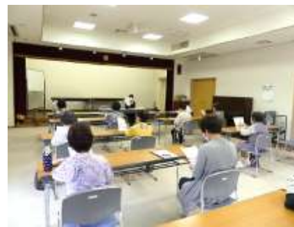
▲地域サロンの支援

河内地区の皆さまには、赤い羽根共同基金を戸別で500円をお願いしております。又、事業経営の皆さまには、法人募金のお願いをしております。民生児童委員、ボランティア、地域福祉を進める会などの皆さまと10月1日（金）～5日（火）に新型コロナウイルス感染予防対策をとりながら、共同基金の街頭運動を展開してまいります。