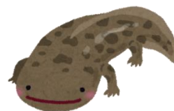
豊栄のオオサンショウウオ

特別養護老人ホーム 豊邑苑 小規模多機能型居宅介護支援事業所 能良の里 グループホーム ふぁみりい豊栄