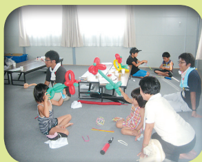
子どもの遊び相手