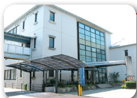
あつたかあきつ応援センター (安芸津文化福祉センター)