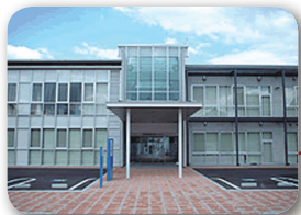
あつたかふくとみ応援センター (福富保健福祉センター)