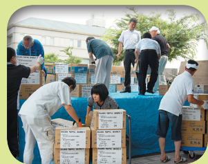
支援物資の仕分け・搬送