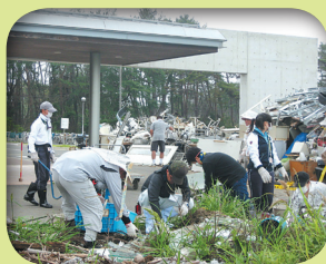
瓦礫の分別・撤去