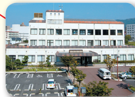
あつたかひがしひろしま応援センター (東広島市総合福祉センター)