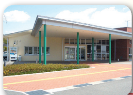
あつたかくろせ応援センター (黒瀬保健福祉センター)