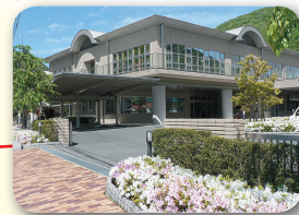
あつたかこうち応援センター (河内保健福祉センター)