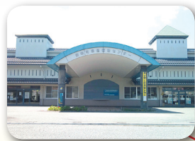
あつたかとよさか応援センター (豊栄保健福祉センター)