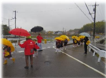
①登校見守りの様子

地区社協のご協力をいただき、見守り活動の啓発を目的に、町内各所に「のぼり旗」を設置していただいております。