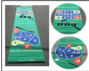
第2位 『ゲーゴル ゲーム』