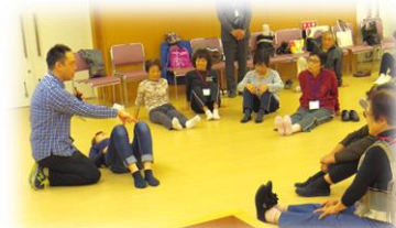
教室の様子 「ひざに負担のない 運動法を学ぶ」