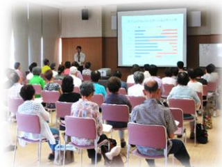
教室の様子「講義中」

一昨年から開催し、大変ご好評いただいている「健康教室」を今年も開催します。講師は、広島国際大学総合リハビリテーション学部の先生方です。参加対象は、65歳以上の方。健康維持に関する勉強や軽い体操などを行います。 開催日程・応募方法等の詳細については、当支所だよりとあわせてお届けしております「健康教室(前期)開催のお知らせ」をご覧ください。