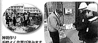
神明作り 手際よく作業が進みます

1月30日、風早小学校1年生が、地域のみなさん8名と神明づくりを行いました。楽しみながら地域の伝統行事を学び、子どもたちに受け継がれていきます。