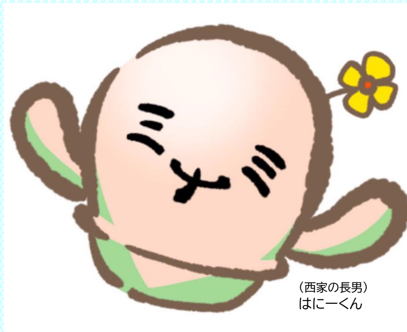
(西家の長男) はにーくん