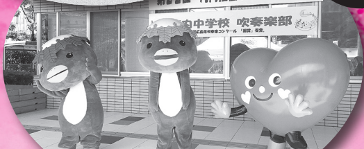
▲河内福祉ふれあいまつり「こころん」と 「体健くん・心美ちゃん」がお出迎え！