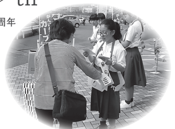
▲黒瀬地区：黒瀬高校の協力で、笑顔で募金をしていただきました