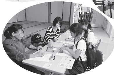
◀点字体験 点字で名前を書いて います