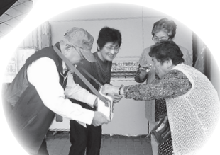
▲豊栄地区：あたたかい思いが込められています