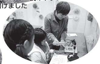
▲音訳体験 うまく読めるかな？