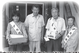
▲河内地区：地域の方と一緒に、街頭募金