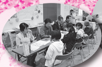
▲はじめての手話体験