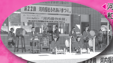
◀河内西小学校による「河内豊作太鼓」。 和文化が代々傳承されています。