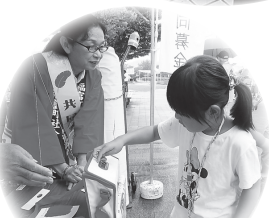
▲福富地区：「アクアフェスタ in 福富」で募金運動