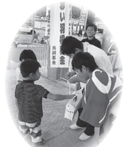
▲安芸津地区：僕たちも応援しています

「ふれあい」特別号(10月号)の「めりえ」にたくさん力作をお寄せ頂き、ありがとうございました。作品は本所、各支所にて展示されています。みなさんで見に来てくださいね。