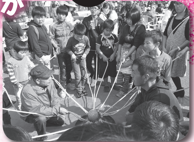
▲子どもたちもたくさん参加、亥の子の様子