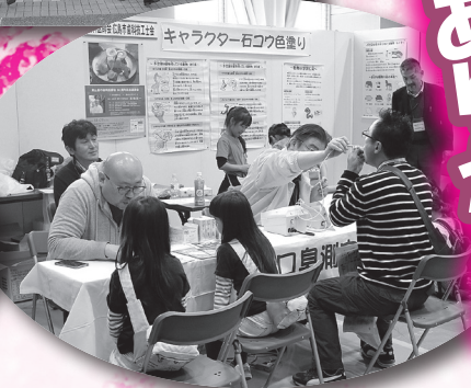
▲口臭チェック中。小さなお子さんも興味深々