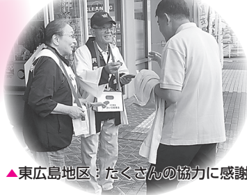
▲東広島地区：たくさんの協力に感謝