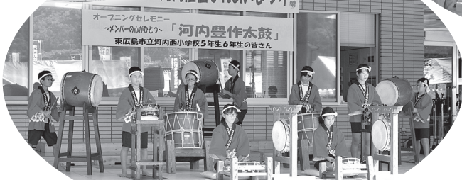
▲河内西小学校「河内豊作太鼓」