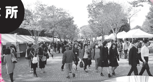
▲たくさんの参加者 で賑わいました