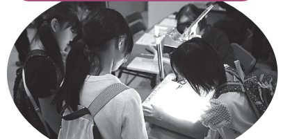
▲要約筆記体験 みんなに読みやすいよう上手に書けました