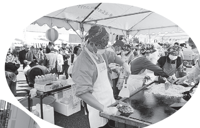
▲バザーコーナーでも、河内高校生徒会が大活躍でした