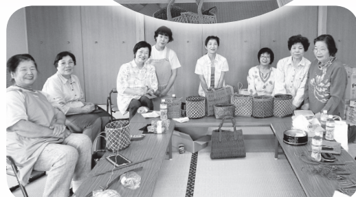
▲素敵なカバンの完成です！