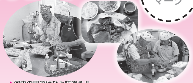
▲河内の男達はひと味違う!!

年4回の楽しみ、四季折々の地元で採れる旬な食材（ときにはワタリガニも！）と、会食を参加者みんなで楽しんでいます。