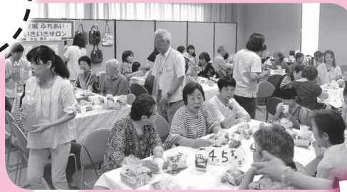
▲人はもちろん、賑やかな声で溢れるサロン会場！

地域の様々な人を引き込み、多くの方に支えられ運営されている素敵なサロンになっています。