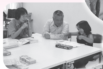
▲学習支援の様子 「ここがわからなかったの～」