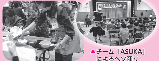
▲抹茶の接待「ひさしぶりに頂いた。おいしかったよ！」