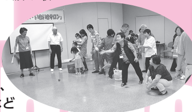
▲民生委員児童委員さんの手作りゲームで大盛り上がり♪