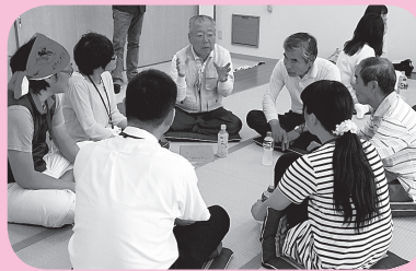
▲6月 グループでサロンの名前を話し合いました。学生は、地区の昔話に興味津々です。

8月 真野本神社の夏祭り。社務所で地元の野菜を使ったカレーを作り、祭りをお手伝い。▶