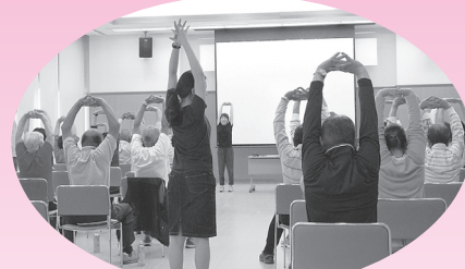
▲9月 リハビリテーション学部の学生が筋力アップの体操を教えてくださいました。