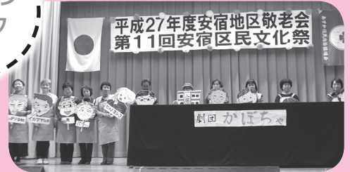
▲福祉部によるペープサート 「困った事があれば、甘えてくれんといけんで～先輩が手本を見せてくれんと、先でわしらも甘えられんけえ～」

社協も地域の皆さんと共に支え合い、助け合いのしくみづくりをすすめ、住み慣れた地域で安心して暮らせるように関わって行きたいと思います。