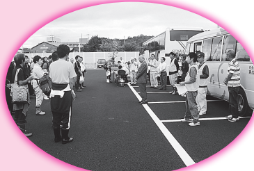
被災者支援ボランティアバスの運行