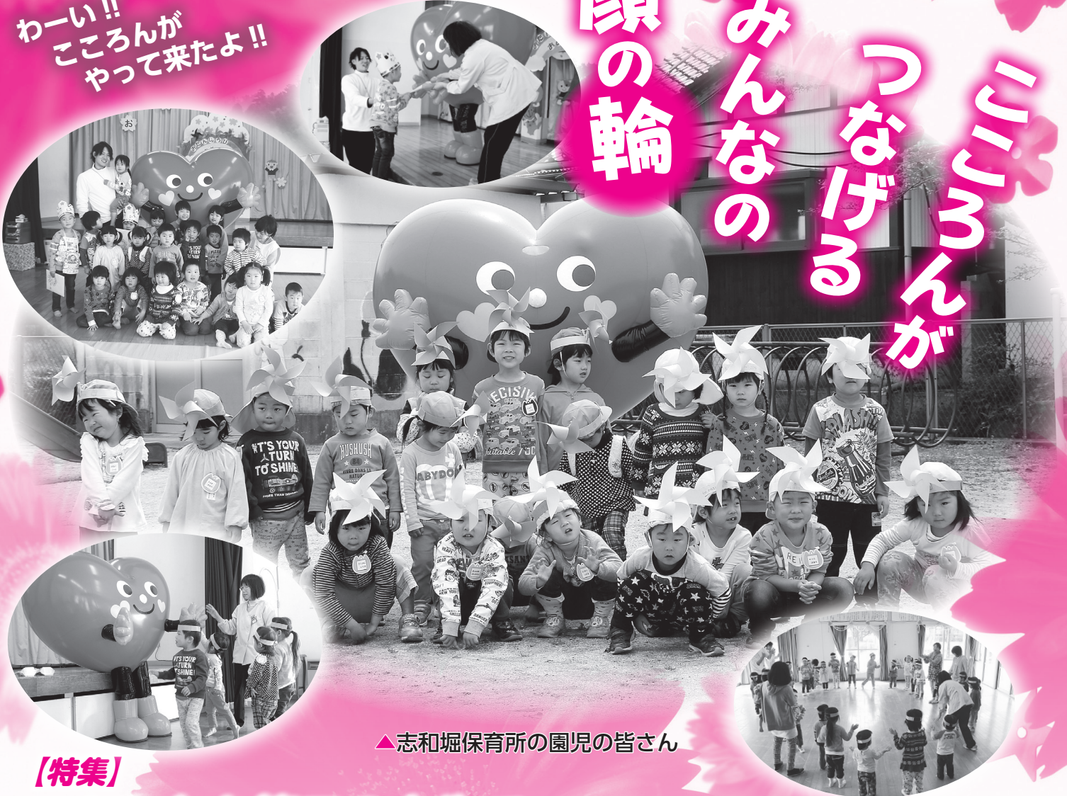
▲志和堀保育所の園児の皆さん