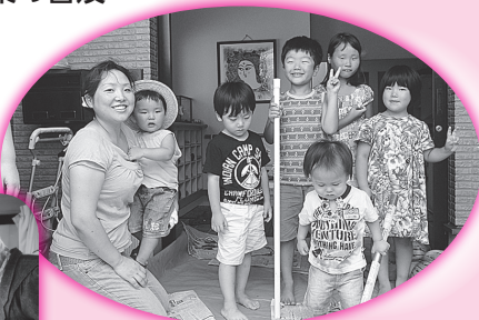
地域サロン活動への支援