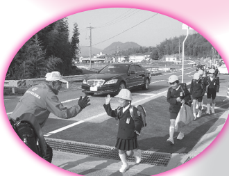
地区社協活動 （登校時の一斉見守り）