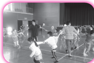
学生ボランティア・児童との交流