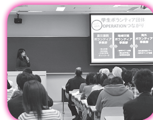
東広島学生ボランティア研修交流会