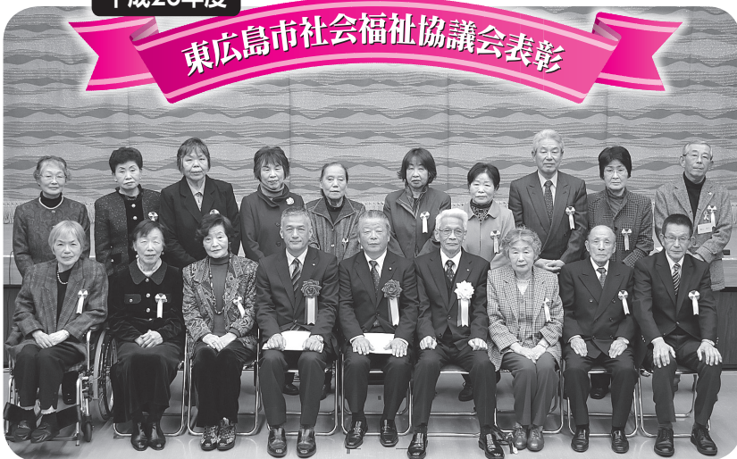
第6回「社協のつどい」において表彰式を行いました。