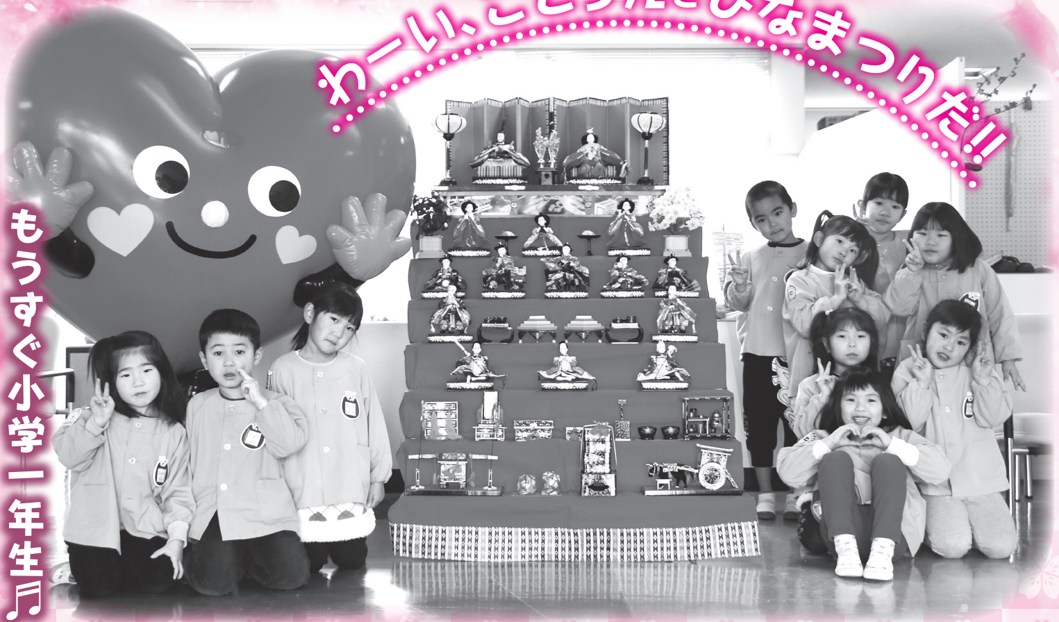
▲豊栄保育所の年長さんたち